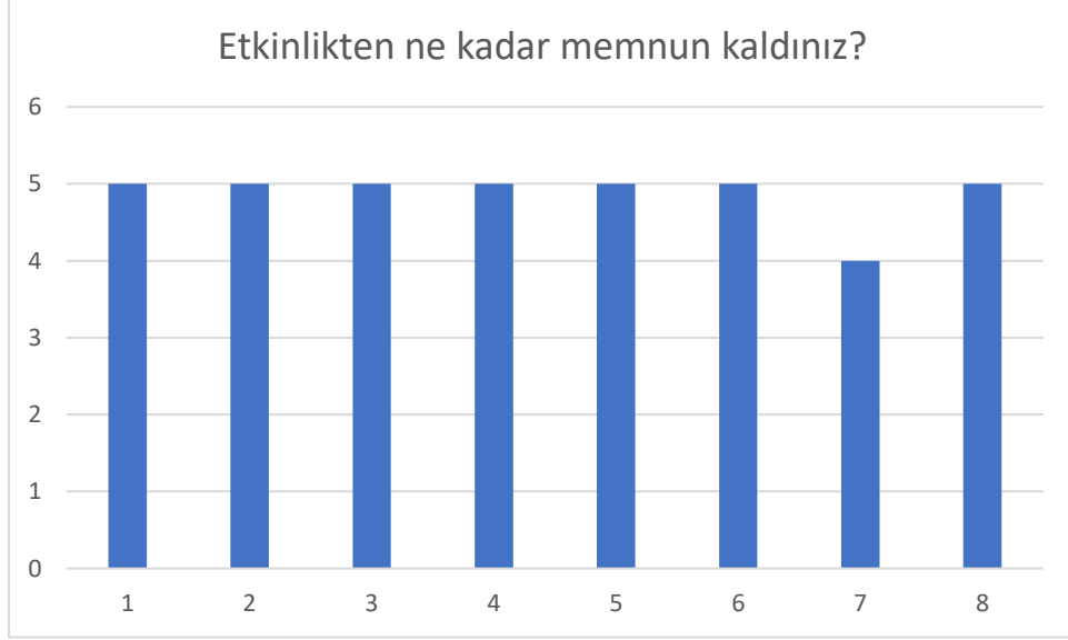
Grafik 1 : Etkinlik Memnuniyetine İlişkin Değerlendirme

Yapılan etkinlik neticesinde öğrencilere yöneltilen etkinlikten ne kadar memnun kaldınız sorusuna; 7 öğrenci 5 puan, 1 öğrenci 4 puan vermiştir.